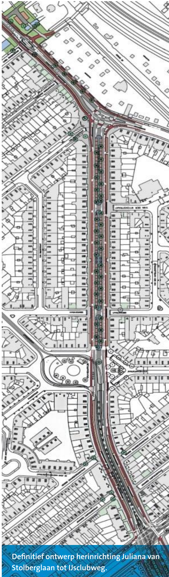
Definitief ontwerp herinrichting Juliana van Stolberglaan tot IJclubweg.